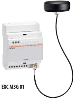
EXC M3G 01