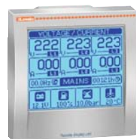
EXC RDU 1