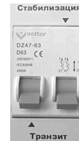
Рис. 6 Отключены оба режима.