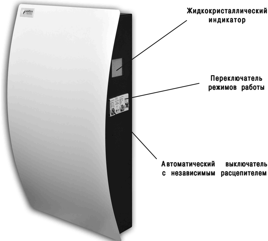
Рис. 1. Стабилизатор напряжения

В верхней части расположен клеммник, для подключения стабилизатора, закрытый крышкой. Там же расположен заземляющий контакт.