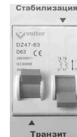
Рис. 7 Режим «Транзит».

1. Выключите автоматический выключатель на боковой панели стабилизатора (вниз).