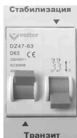
Рис.9. Режим «Транзит»

1. Выключите автоматический выключатель на лицевой панели стабилизатора (вниз).