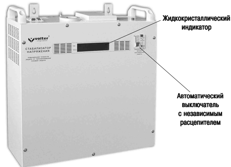
Рис. 1. Стабилизатор напряжения

Стабилизатор (рис.1) выполнен в металлическом корпусе прямоугольной формы, который позволяет эксплуатировать его как в настенном, так и в напольном варианте. Все функциональные узлы стабилизатора расположены на шасси, которое закрыто лицевой частью корпуса и днищем. Для удобства переноски стабилизатора имеются ручки.