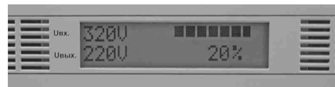
Рис. 2. Жидкокристаллический индикатор

На лицевой панели корпуса расположены жидкокристаллический индикатор (Рис.2), который в режиме «стабилизация» отображает входное и выходное напряжение, состояние электронных ключей и ток нагрузки в процентах, а также автоматический выключатель с независимым расцепителем (Рис.3).