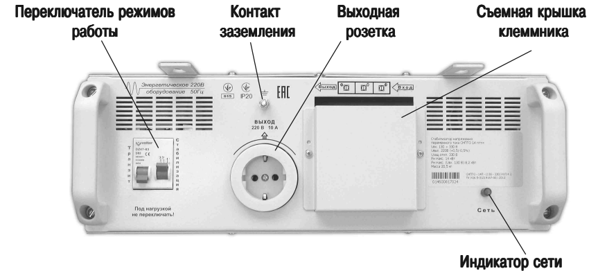
Рис. 4. Верхняя панель стабилизатора

Принцип работы стабилизатора обеспечивает отсутствие влияния на выходное напряжение как изменений и скачков входного напряжения, так и изменений нагрузки. Для этого он содержит источник образцового напряжения с частотой сети и стабильной величиной, с которым непрерывно сравнивается выходное напряжение стабилизатора. Благодаря такому построению стабилизатора, он не реагирует даже на очень резкие, практически мгновенные изменения входного напряжения, и очень быстро реагирует на любое изменение нагрузки. Так же реализована независимость от типа нагрузок, то есть стабилизатор одинаково работает с активной, емкостной и индуктивной нагрузкой, если выходной ток не превышает его допустимого выходного тока.